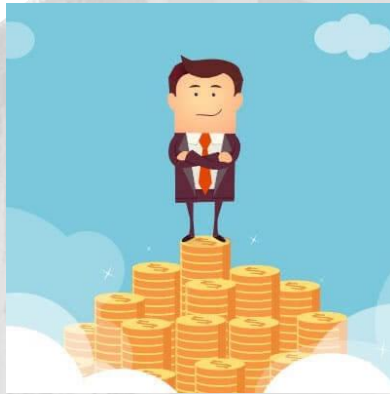
INVESTOR/ PEMILIK MODAL