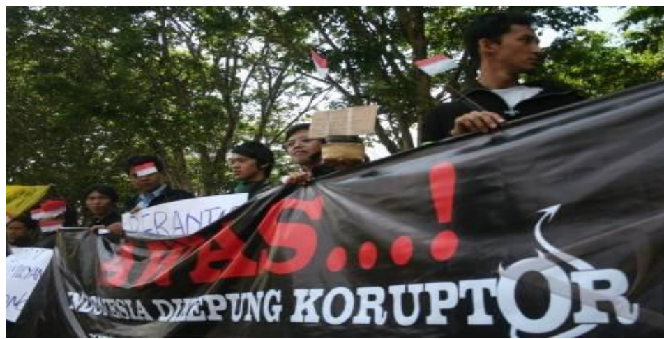
Gambar: Unjuk rasa mahasiswa menentang korupsi

( http://www.metrotvnews.com/metronews/read/2013/12/03/7/198717/Indonesia-Peringkat-64-Negara-Paling-Korup-di-Dunia ).