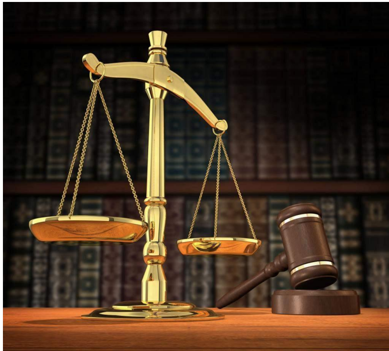
Gambar: simbol hukum

Salah satu tujuan dari gerakan reformasi adalah mereformasi sistem hukum dan sekaligus meningkatkan kualitas penegakan hukum. Memang banyak faktor yang berpengaruh terhadap efektivitas penegakan hukum, namun faktor dominan dalam penegakan hukum adalah faktor manusianya. Konkritnya penegakan hukum ditentukan oleh kesadaran hukum masyarakat dan profesionalitas aparaturnya. Inilah salah satu urgensi dari mata kuliah pendidikan Pancasila, yaitu meningkatkan kesadaran hukum para mahasiswa sebagai calon pemimpin bangsa.