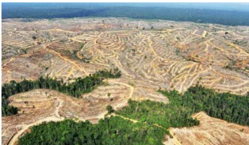
Gambar: Pembalakan hutan di Kalimantan

Indonesia dikenal sebagai paru-paru dunia. Namun dewasa ini, citra tersebut perlahan mulai luntur seiring dengan banyaknya kasus pembakaran hutan, perambahan hutan menjadi lahan pertanian dan yang paling santer dibicarakan yaitu beralihnya hutan Indonesia menjadi perkebunan.