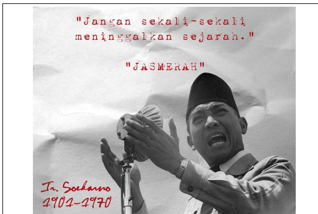
Gambar: Pidato Presiden Soekarno

Presiden Soekarno pernah mengatakan”jangan sekali-kali meninggalkan sejarah.” Pernyataan tersebut dapat dimaknai bahwa sejarah mempunyai fungsi penting dalam membangun kehidupan bangsa dengan lebih bijaksana di masa depan. Hal tersebut sejalan dengan ungkapan seorang filsuf yunani yang bernama Cicero (106-43 SM) yang mengungkapkan “ Historia Vitae Magistra ”, yang