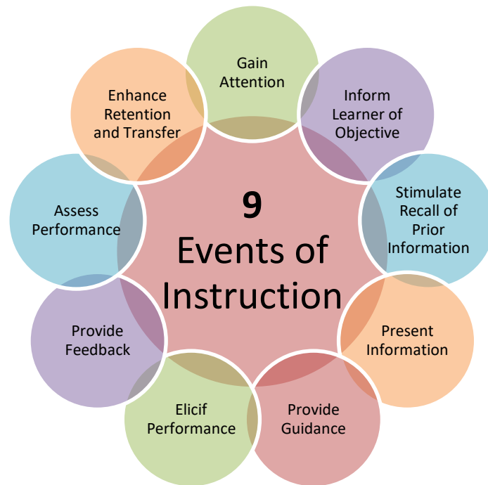
Gambar 2.2 Sembilan Peristiwa Pembelajaran Gagne & Briggs