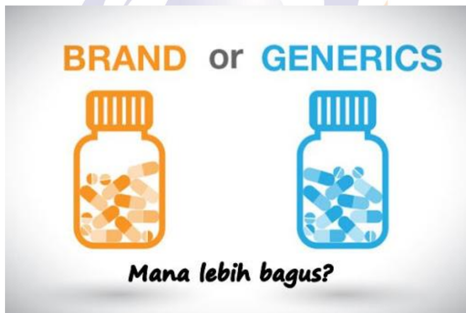
Gambar 8.4 Obat Generik dan Obat Paten

Tingginya biaya pengobatan dan harga obat di Indonesia menjadikan masyarakat memilih untuk mengobati sendiri penyakitnya. Bahkan sebagian masih menggunakan penyembuhan secara tradisional dan ada yang dengan mengkonsumsi obat-obatan di warung tanpa mengetahui apakah obat tersebut fungsinya sesuai dengan penyakit yang diderita. Memerhatikan kondisi ini maka pemerintah melalui Kementerian Kesehatan mengeluarkan program obat generik yang udah diakses di puskesmas, rumah sakit bahkan apotik-apotik di seluruh Indonesia, selain itu harganya pun terjangkau. Namun masih banyak khalayak ramai yang tidak percaya dengan khasiatnya sehingga mereka lebih memilih membeli obat yang mahal dengan persepsi ada harga ada rupa.