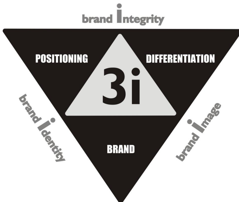
Gambar 8.3 3i Marketing Triangle

Menurut para ahli, pemasaran sosial pada dasarnya merupakan aplikasi strategi pemasaran komersil untuk “menjual” gagasan dalam rangka mengubah sebuah masyarakat oleh sebab itu apabila seseorang atau organisasi ingin memasarkan produknya maka ia harus mempelajari seni “menjual” diri dengan mempraktikkan prinsip-prinsip promosi tanpa memaksa, memahami dan menerapkan positioning secara tepat, memahami branding dan diferensiasi. Dengan melakukan ketiga hal tersebut maka seseorang atau organisasi telah menjalankan marketing dengan benar. Hermawan menyebutnya dengan istilah 3i marketing triangle yaitu positioning (cara sasaran/public yang hendak diubah perilakunya mendefinisikan perusahaan/organisasi dengan competitor), differentiation (perbedaan) dan brand (keunikan, ketajaman dan fokus sebuah produk dibandingkan dengan produk lainnya bisa berupa logo yang unik) (Chasanah, 2013)