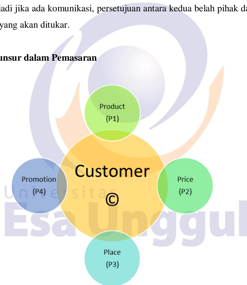
Gambar 8.1 Unsur-unsur Pemasaran Sosial

Pemasaran memiliki empat unsur pokok yaitu produk (product), harga (price), tempat (place) dan promosi (promotion) dengan konsumen (customer) sebagai pusat pemasarannya. Oleh sebab itu, dalam pemasaran perlu mempelajari perilaku konsumen, gaya hidup dan kebiasaan konsumen agar pemasar dapat mengidentifikasi kebutuhan konsumen (P1), menentukan harga (P2), menentukan tempat pemasaran agar mudah