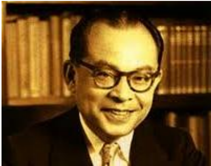
Gambar VI.2 Bung Hatta: “demokrasi Indonesia adalah kedaulatan rakyat berdasarkan kolektivitas yang bersifat desentralistik”. Apa maksudnya?

hanya berdaulat dalam bidang politik, tetapi juga dalam bidang ekonomi dan sosial.