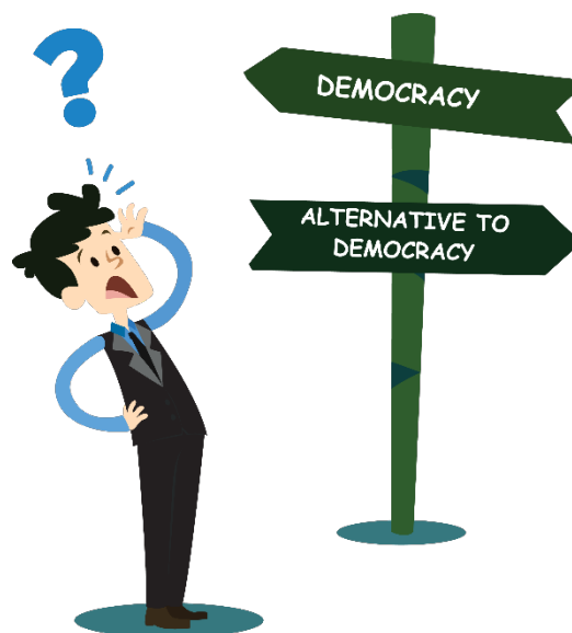
Gambar VI.3 Pilih demokrasi atau nondemokrasi?

Perkembangan demokrasi semakin pesat dan diterima semua bangsa terlebih sesudah Perang Dunia II. Suatu penelitian dari UNESCO tahun 1949 menyatakan “mungkin bahwa untuk pertama kalinya dalam sejarah, demokrasi dinyatakan sebagai nama yang paling baik dan wajar untuk semua sistem organisasi politik dan sosial yang diperjuangkan oleh pendukung-pendukung yang berpengaruh”.