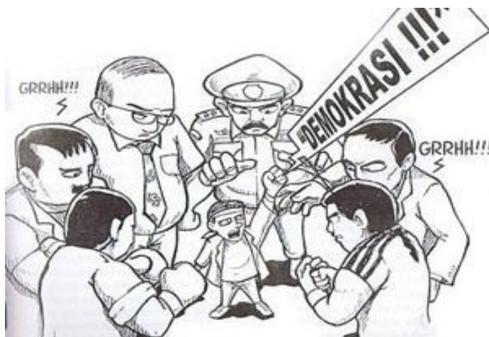
Gambar VI.1 Dalam demokrasi, rakyat berdaulat, benarkah?

Setiap negara mempunyai ciri khas dalam pelaksanaan kedaulatan rakyat atau demokrasinya. Hal ini ditentukan oleh sejarah negara yang bersangkutan, kebudayaan, pandangan hidup, serta tujuan yang ingin dicapainya. Dengan demikian pada setiap negara terdapat corak khas demokrasi yang tercermin pada pola sikap, keyakinan dan perasaan tertentu yang mendasari, mengarahkan, dan memberi arti pada tingkah laku dan proses berdemokrasi dalam suatu sistem politik.