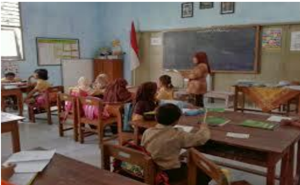
Gambar 1.4 Belajar PKn, apa pentingnya?

Istilah-istilah di atas merupakan pengantar bagi Anda untuk menelusuri lebih lanjut tentang pendidikan kewarganegaraan di negara lain.