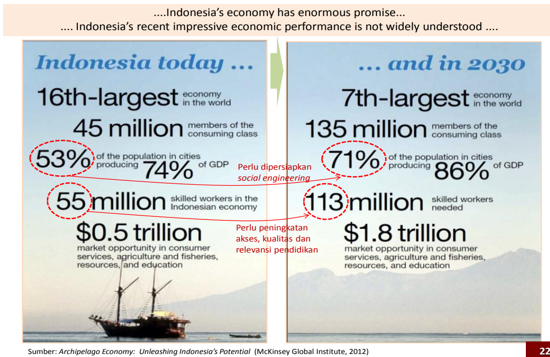
Gambar 1.9 Ekonomi Indonesia kini dan tahun 2030. Akankah ekonomi Indonesia yang menjanjikan dapat terwujud pada tahun 2030? Bagaimanakah upaya yang harus dilakukan?

Menurut data di atas, ekonomi Indonesia sangat menjanjikan walaupun kondisinya saat ini belum dipahami secara luas. Saat ini, ekonomi Indonesia berada pada urutan 16 besar dan pada tahun 2030, ekonomi Indonesia akan berada pada urutan 7 besar dunia. Saat ini, jumlah konsumen sebanyak 45 juta dan jumlah penduduk produktif sebanyak 53%. Pada tahun 2030, jumlah konsumen akan meningkat menjadi 135 juta dan jumlah penduduk produktif akan meningkat menjadi 71%. Bagaimana perubahan lain akan terjadi pada masa depan Indonesia, khususnya pada Generasi Emas Indonesia?