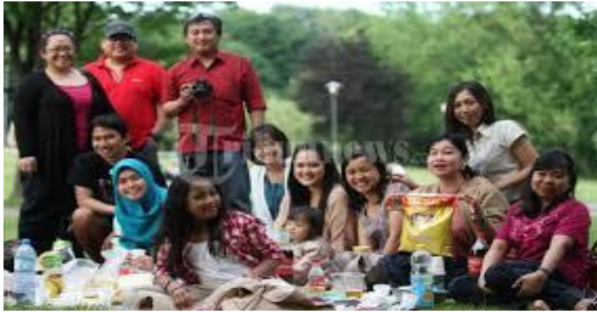
Gambar 1.3 Untuk menjadi WNI, karakteristik apa saja yang perlu dipenuhi?

Apa yang dapat Anda kemukakan dari pernyataan di atas? Sudahkah Anda mampu membedakan konsep warga negara, kewarganegaraan, dan pendidikan kewarganegaraan ?