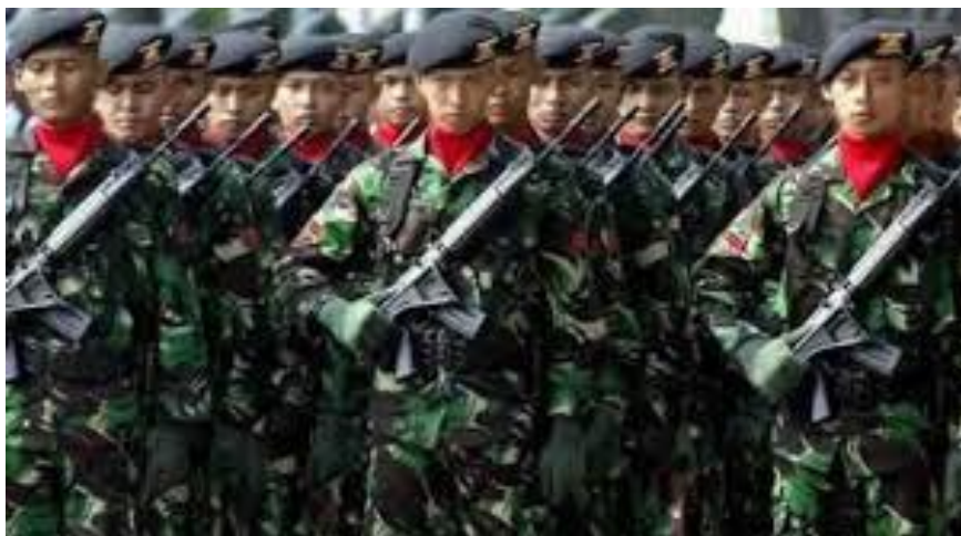
Gambar 1.2 Apakah TNI merupakan warga negara Indonesia? Apa bedanya dengan warga lain?

Setelah Indonesia memasuki era kemerdekaan dan era modern, istilah kawula negara telah mengalami pergeseran. Istilah kawula negara sudah tidak digunakan lagi dalam konteks kehidupan berbangsa dan bernegara di Indonesia saat ini. Istilah “warga negara” dalam kepustakaan Inggris dikenal dengan istilah “ civic ”, “ citizen ”, atau “ civicus ”. Apabila ditulis dengan mencantumkan “s” di bagian belakang kata civic menjadi “ civics ” berarti disiplin ilmu kewarganegaraan.