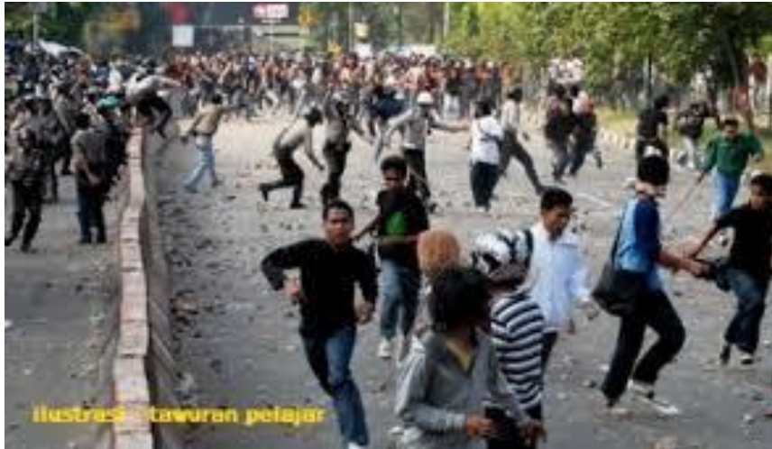
Gambar 1.7 Apa kontribusi PKn terhadap dinamika dan tantangan kehidupan di atas?