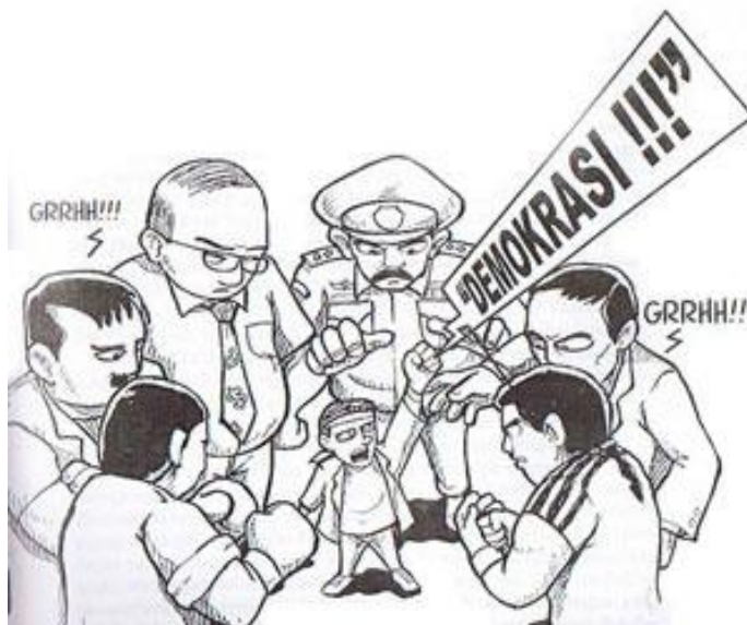
Gambar 6.1 Dalam demokrasi, rakyat berdaulat, benarkah?

Setiap negara mempunyai ciri khas dalam pelaksanaan kedaulatan rakyat atau demokrasinya. Hal ini ditentukan oleh sejarah negara yang bersangkutan, kebudayaan, pandangan hidup, serta tujuan yang ingin dicapainya. Dengan demikian pada setiap negara terdapat corak khas demokrasi yang tercermin pada pola sikap, keyakinan dan perasaan tertentu yang mendasari, mengarahkan, dan memberi arti pada tingkah laku dan proses berdemokrasi dalam suatu sistem politik.