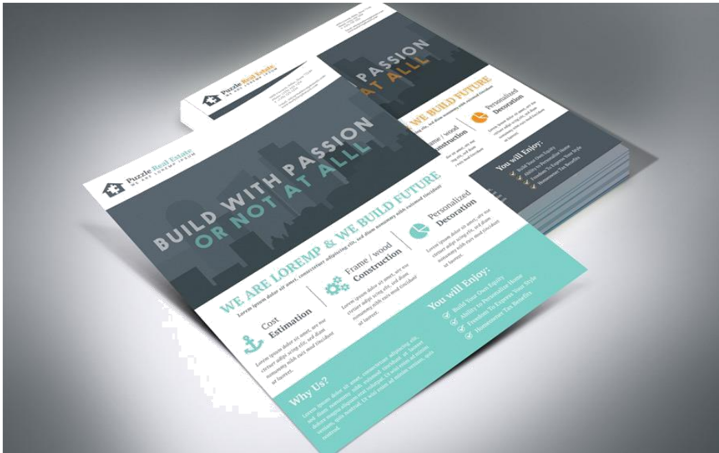
Gambar 1.5.1 Flyer