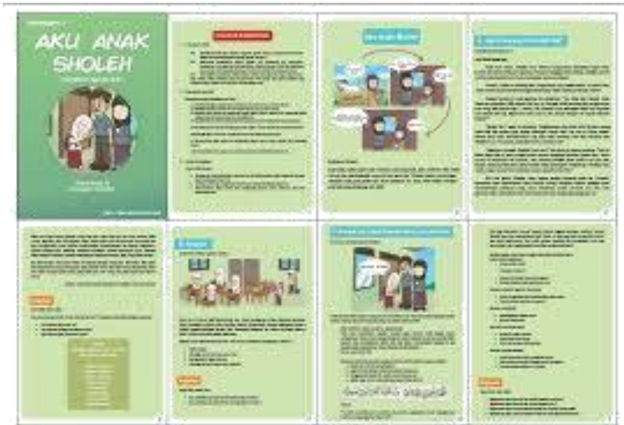
Gambar 3.1.2 (Contoh brosur Agama Islam)