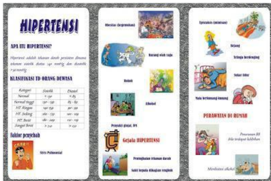
Gambar 3.2.1 (Contoh leaflet hipertensi)