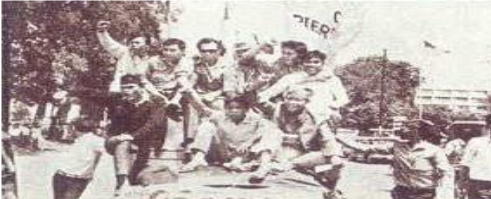
Gambar II.4: Demonstrasi Tritura oleh mahasiswa pada 1966, salah satunya menuntut penurunan harga bahan pokok

Peristiwa G30S PKI menimbulkan peralihan kekuasaan dari Soekarno ke Soeharto. Peralihan kekuasaan itu diawali dengan terbitnya Surat Perintah dari Presiden Soekarno kepada Letnan Jenderal Soeharto, yang di kemudian hari terkenal dengan nama Supersemar (Surat Perintah Sebelas Maret). Surat itu intinya berisi perintah presiden kepada Soeharto agar “mengambil langkah-langkah pengamanan untuk menyelamatkan keadaan” . Supersemar ini dibuat di Istana Bogor dan dijemput oleh Basuki Rahmat, Amir Mahmud, dan M. Yusuf.