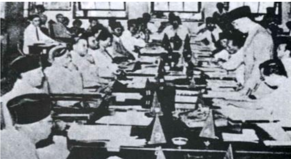
Gambar II.1: Penyampaian usulan tentang dasar negara oleh Ir. Soekarno dalam sidang BPUPKI.