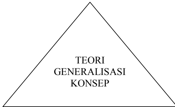
Gambar 8.1. Struktur Ilmu Pengetahuan Sosial.

Jacob Bronowski (Supardi, 2011, p. 13) menjelaskan bahwa ilmu adalah aktivitas menyusun fakta-fakta yang diketahui dalam kelompok-kelompok di bawah konsep-konsep umum, dan konsep-konsep itu dinilai berdasarkan pernyataan dari tindakan-tindakan yang kita dasarkan padanya. Dengan demikian, dapat disimpulkan bahwa batang tubuh ilmu strukturnya mencakup: fakta, konsep, generalisasi, dan teori. Berikut gambar di bawah ini.