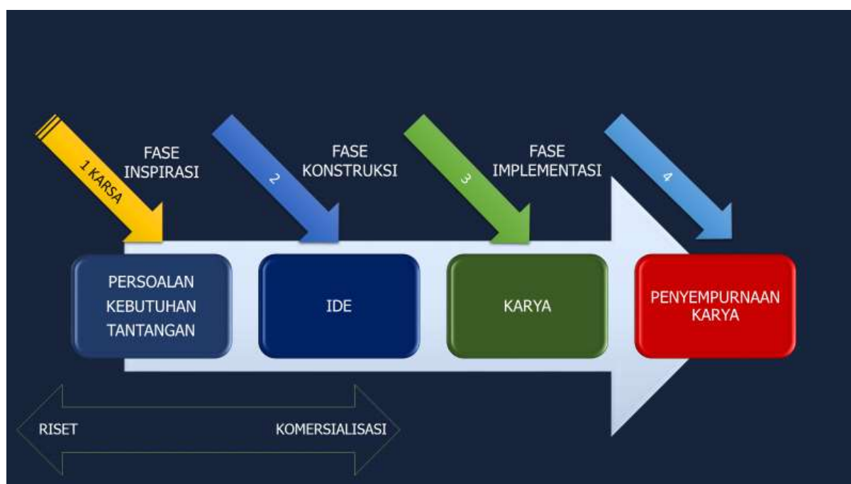
Gambar 1. Bagan alir proses konstruksi ide dalam PKM-KC

Tahap akhir PKM-KC adalah Fase Implementasi di mana produk dapat difungsikan dan dinilai level kemanfaatannya. Dalam kasus tertentu, jika produk PKM-KC belum fungsional, paling tidak fase Konstruksi sudah tercapai dan dilakukan uji coba (lihat Gambar 2.).