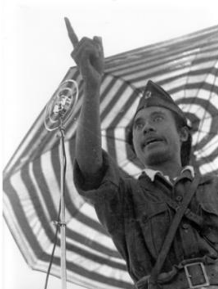
Gambar V.3: Bung Tomo, salah satu pahlawan nasional yang berhasil menggerakkan semangat rakyat melalui orasi dan pidato-pidatonya.

dalam sejarah perjuangan bangsa Indonesia. Namun, harus pula diakui bahwa para pahlawan dan tokoh-tokoh pergerakan nasional itu tidak mungkin bergerak sendiri untuk mencapai kemerdekaan bangsa Indonesia. Peristiwa Sepuluh November di Surabaya ketika terjadi pertempuran antara para pemuda, arek-arek Surabaya dan pihak sekutu membuktikan bahwa Bung Tomo berhasil menggerakkan semangat rakyat melalui orasi dan pidato-pidatonya. Dengan demikian, manusia sebagai makhluk individu baru mempunyai arti ketika berelasi dengan manusia lain sehingga sekaligus menjadi makhluk sosial.