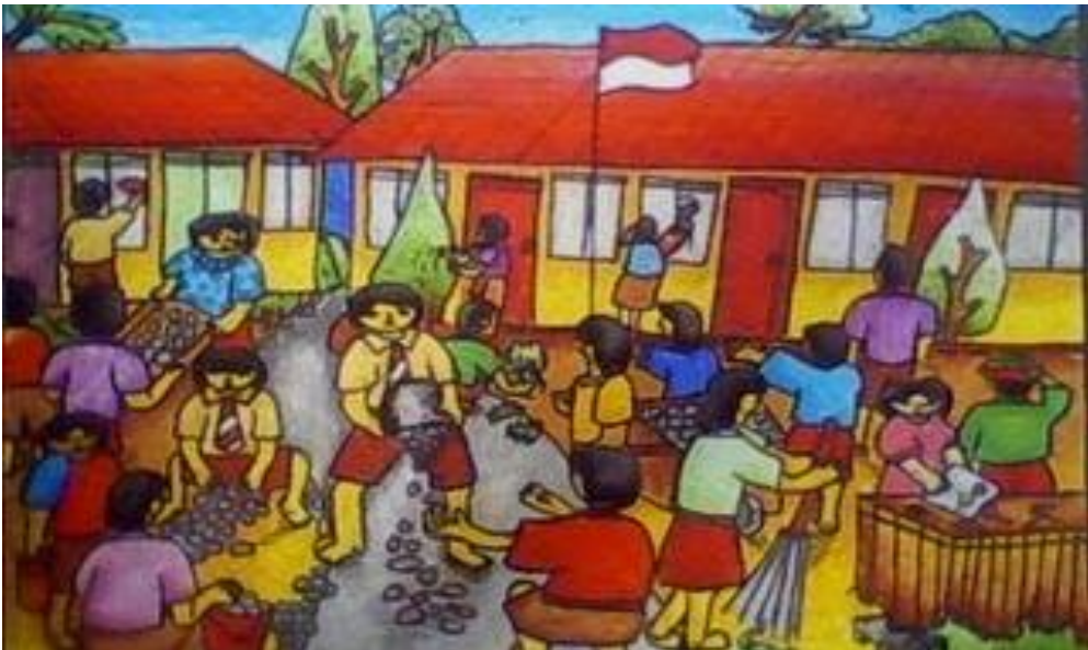
Gambar V.5: Gotong royong merupakan budaya masyarakat Indonesia. Hal ini menumbuhkan sikap sukarela, tolong-menolong, kebersamaan, dan kekeluargaan antar sesama anggota masyarakat

Landasan aksiologis Pancasila artinya nilai atau kualitas yang terkandung dalam sila-sila Pancasila. Sila pertama mengandung kualitas monoteis, spiritual, kekudusan, dan sakral. Sila kemanusiaan mengandung nilai martabat, harga diri, kebebasan, dan tanggung jawab. Sila persatuan mengandung nilai solidaritas dan kesetiakawanan. Sila keempat mengandung nilai demokrasi, musyawarah, mufakat, dan berjiwa besar. Sila keadilan mengandung nilai kepedulian dan gotong royong.