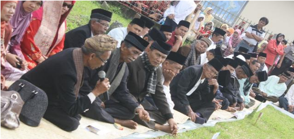
Gambar V.4: Musyawarah merupakan ciri khas masyarakat Indonesia dalam menyelesaikan masalah.

Sila Persatuan Indonesia digali dari pengalaman atas kesadaran bahwa keterpecahbelahan yang dilakukan penjajah kolonialisme Belanda melalui politik Divide et Impera menimbulkan konflik antarmasyarakat Indonesia. Sila Kerakyatan yang Dipimpin oleh Hikmat Kebijaksanaan dalam Permusyawaratan/Perwakilan digali dari budaya bangsa Indonesia yang sudah mengenal secara turun temurun pengambilan keputusan berdasarkan semangat musyawarah untuk mufakat. Misalnya, masyarakat Minangkabau mengenal peribahasa yang berbunyi " Bulek aie dek pambuluh, bulek kato dek mufakat ", bulat air di dalam bambu, bulat kata dalam permufakatan. Sila Keadilan Sosial bagi Seluruh Rakyat Indonesia digali dari prinsip-prinsip yang berkembang dalam masyarakat Indonesia yang tercermin dalam sikap gotong royong.