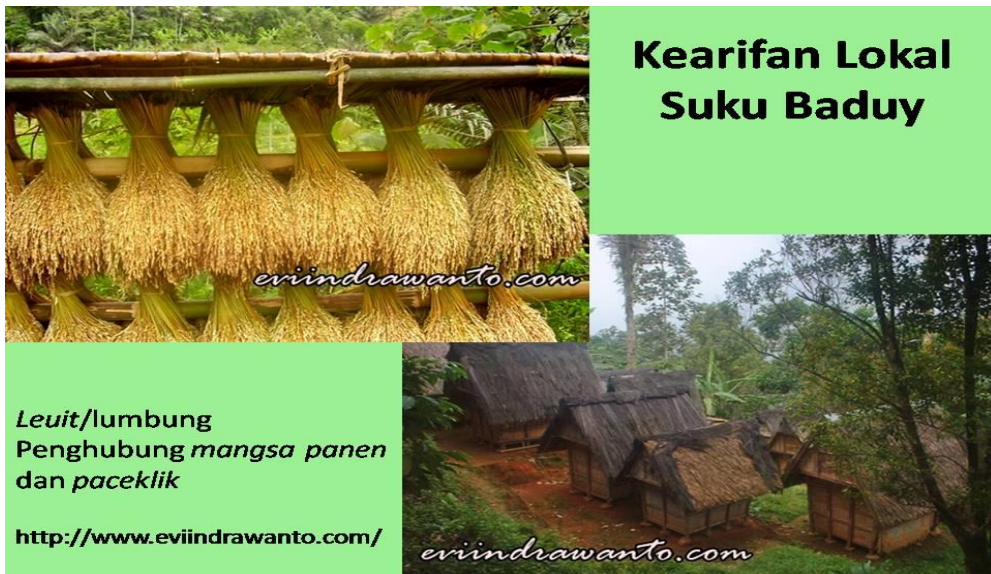
Gambar V.6: Salah satu kearifan lokal Suku Baduy adalah menyimpan padi di lumbung untuk mengatasi masa paceklik (kesusahan/kekurangan pangan)