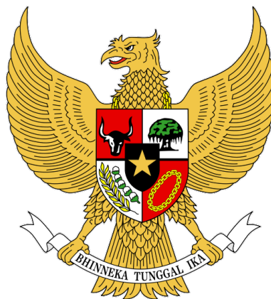
Gambar V.7: Burung Garuda Pancasila sebagai simbol Negara ( http://agusramdanirekap.blogspot.com/2011/12/arti-dan-makna-lambang-garuda-pancasila.html )

Tahukah Anda apa yang dimaksudkan dengan simbol itu? Simbol menurut teori Semiotika Peirce adalah bentuk tanda yang didasarkan pada konvensi. (Berger, 2010: 247). Simbol adalah tanda yang memiliki hubungan dengan objeknya berdasarkan konvensi, kesepakatan, atau aturan. Simbol ditandai dengan kesepakatan, seperti halnya bahasa, gerak isyarat, yang untuk memahaminya harus dipelajari. Makna suatu simbol ditentukan oleh suatu persetujuan atau kesepakatan bersama, atau sudah diterima oleh umum sebagai suatu kebenaran. Contoh, lampu lalu lintas adalah simbol, yakni warna merah artinya berhenti, hijau berarti jalan, warna kuning berarti pengguna jalan harus berhati-hati. Simbol adalah sesuatu yang maknanya diterima sebagai suatu kebenaran melalui konvensi atau aturan dalam kehidupan dan kebudayaan masyarakat yang telah disepakati. Demikian pula halnya dengan Burung Garuda, diterima sebagai simbol oleh bangsa Indonesia melalui proses panjang termasuk dalam konvensi. Contoh, simbol Burung Garuda sebagai berikut: