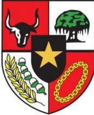
Gambar V.8: Perisai Pancasila