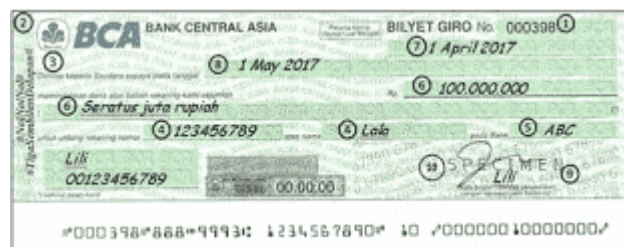
Contoh Bilyet Giro

Pengertian Bilyet Giro adalah surat pemindahbukukan sejumlah uang dari rekening nasabah suatu bank yang bersangkutan kepada nasabah yang mempunyai rekening di bank yang namanya disebutkan dalam bilyet giro pada bank yang sama atau pada bank lain (berbeda).