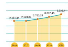
Penjualan Bersih Net Sales (miliar Rupiah | billion Rupiah)

Penjualan bersih terus tumbuh dengan CAGR 6,8% dalam 5 tahun terakhir. Net sales has consistently grew with a CAGR of 6.8% in the past 5 years.