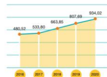
Laba Bersih Net Income (miliar Rupiah | billion Rupiah)

Laba tahun berjalan terus meningkat dengan CAGR 18,1% dalam 5 tahun terakhir. Profit for the year has consistently increased with a CAGR of 18.1% in the past 5 years.