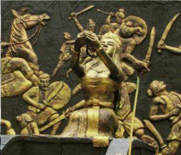
Perang Bubat (Jawa-Sunda)