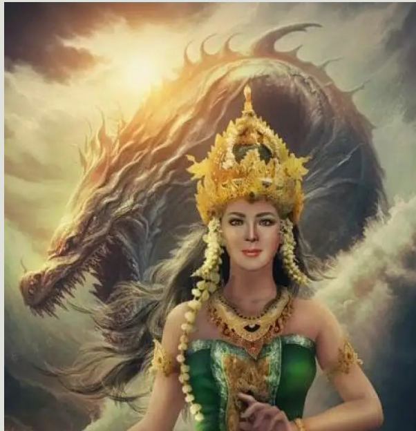
Ratu Pantai Selatan