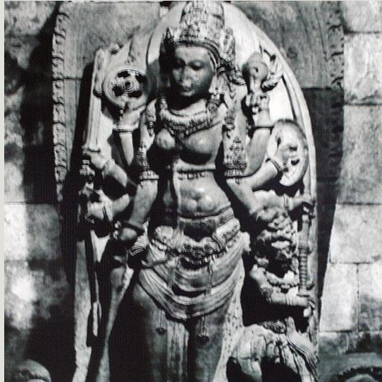
Arca rara jonggrang