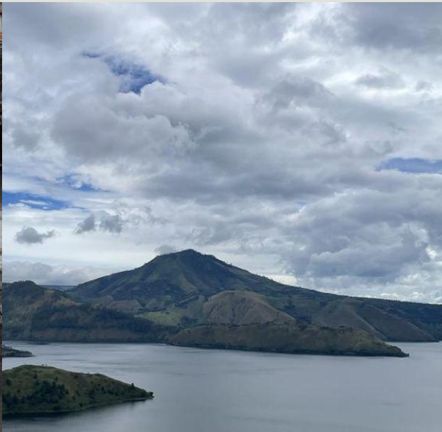
Legenda Danau Toba